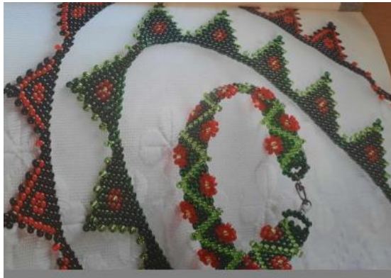
Oláh Márta :Népi gyöngyészerek könyvből