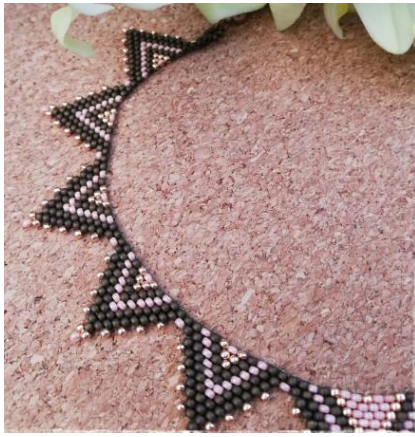
Aszakkör 16. Somogyi cakkos nyaklánc