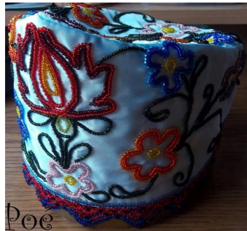
Pálné Oswald Éva Népi gyöngyűző munája ,gyöngyös cakk a főkötön