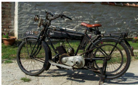
Terrot 175, 1924-ből. Kétütemű erőforrással szerelték

1. Az értéktárba felvételre javasolt nemzeti érték fényképe vagy audiovizuális-dokumentációja