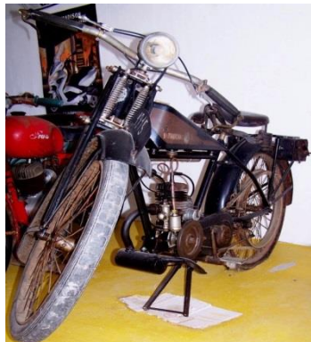
Diamond, vagyis gyémánt - a kiállítás legidősebb darabja, 1915-ből