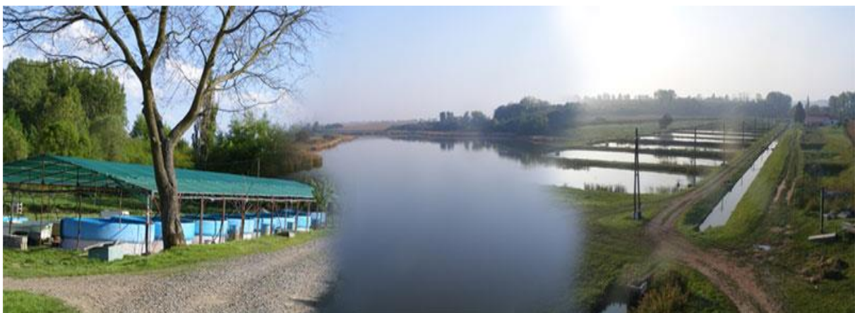
Termelői tó, medencék, telelő tó