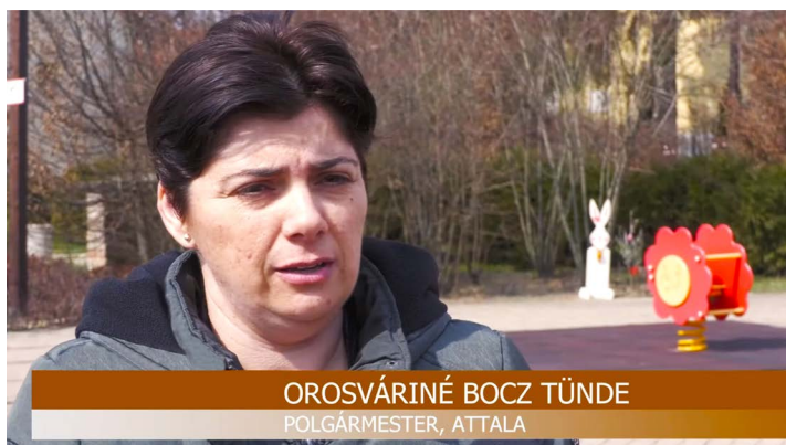
OROSVÁRINÉ BO CZ TÜNDE POLGÁRMESTER, ATTALA